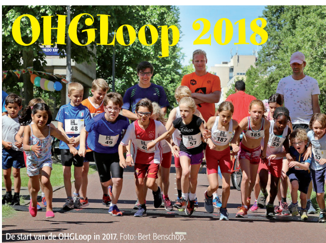
De start van de OHG Loop in 2017.

Op zondag 27 mei is het zover en is de leukste loop van Amsterdam terug voor alweer de 4e editie. Doe mee en ervaar de buurt zoals je het nog niet eerder ervaren hebt. Traditioneel bestaat de loop uit een 1, 2 en 3 km voor kinderen en een 5 en 10 km voor volwassenen. Daarnaast zal het Hildo Kropplein omgetoverd worden tot een groot sportfeestje met: springkussen, muziek, kinderspellen, kans op mooie prijzen en meer! Info over de inschrijving volgt snel!