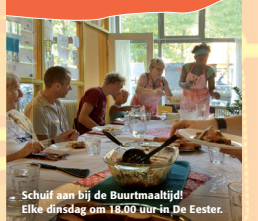
Schrijf aan bij de Buurtmaaltijd! Elke dinsdag om 18:00 uur in De Eester.