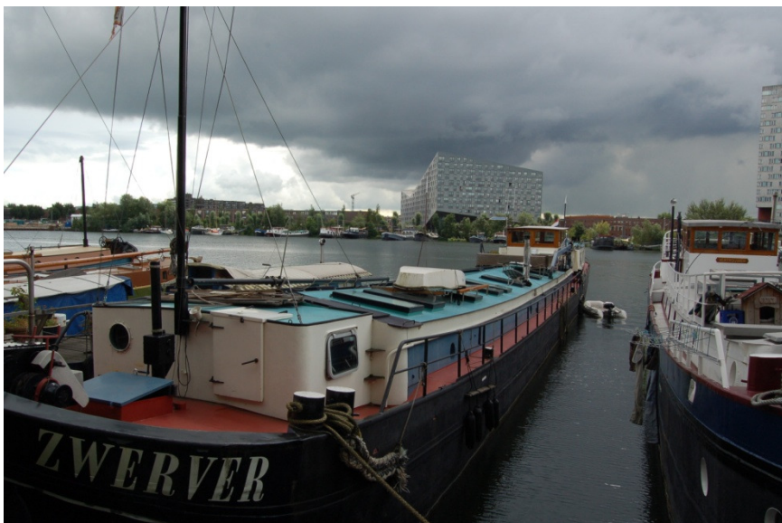
Met lage schepen blijft het zicht op het water en de overkant behouden