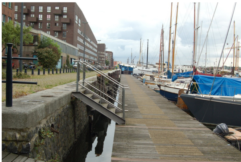
Lage steigers zijn per trap bereikbaar