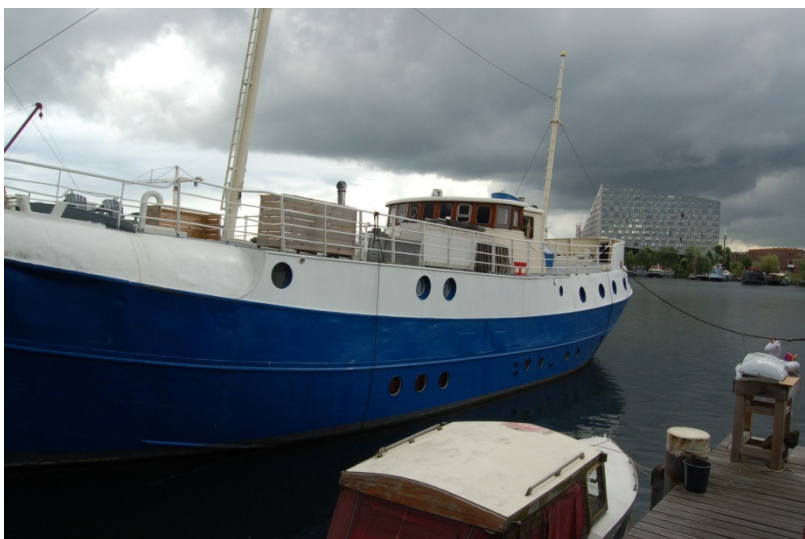
Zicht op het water