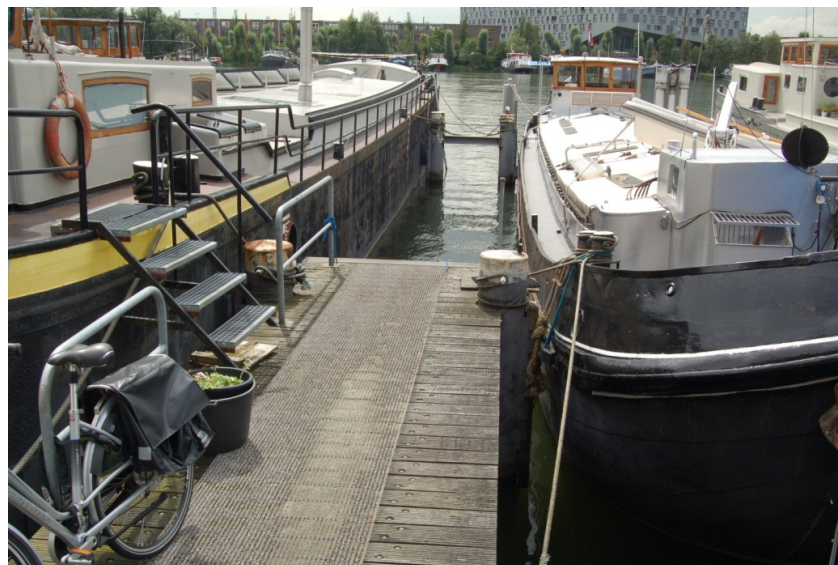
Vingerpielen zijn even hoog als de kade en bieden toegang tot schepen