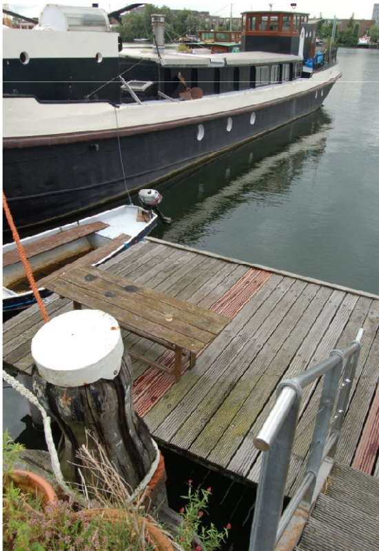
Kade en lage steiger met terras Kanis & Meiland