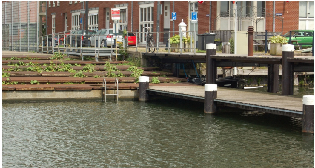
Hoge steiger, lage steiger, watertrap en zwemtrap aan het KNSM-eiland